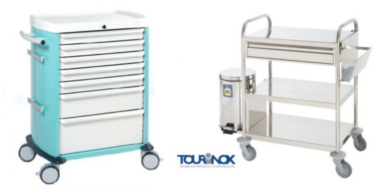
Guéridon livré nu sans accessoires